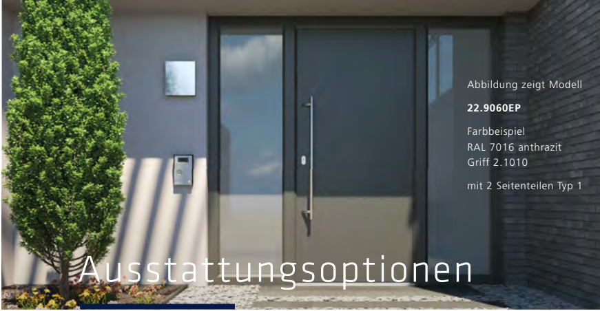
Abbildung zeigt Modell 22.9060EP Farbbeispiel RAL 7016 anthrazit Griff 2.1010 mit 2 Seitenteilen Typ 1